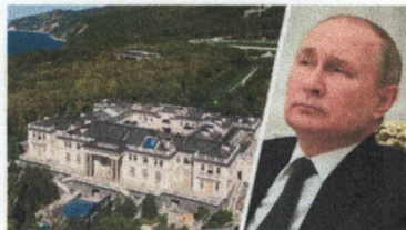
Putin: Der wahrscheinlich reichste Mensch der Welt