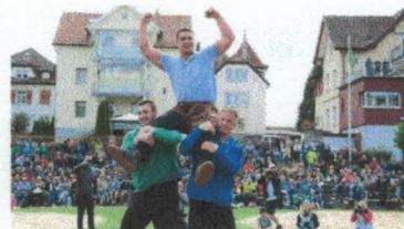
St.Galler Kantonschwingfest 2022 in Wil - Liveticker